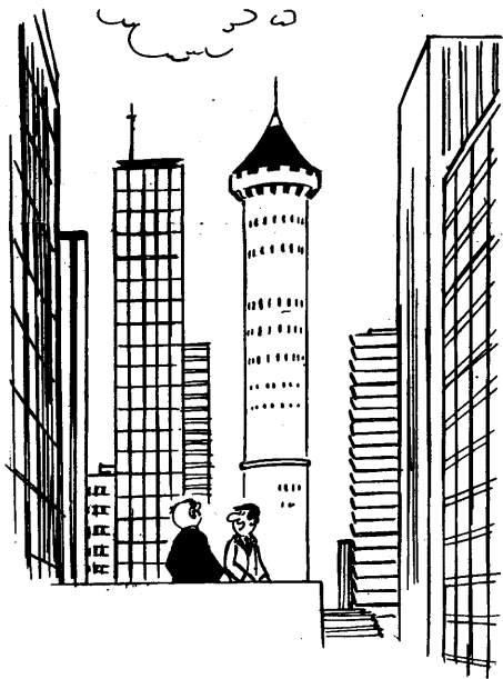
— Là nous sommes revenus à une architecture beaucoup plus traditionnelle.

Car cette statue séculaire, à laquelle le quartier doit son nom et qui trônait naguère en son rond-point central, continue de monter la garde. Installée provisoirement au-dessus de l'emplacement de la future gare routière, elle forme un curieux contraste avec les témoignages de l'art contemporain qui la cernent au loin.