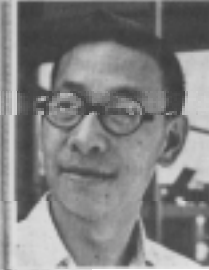
I.M. PEI et le projet Pei-Cossuta. (Au fond, l'Étoile.)