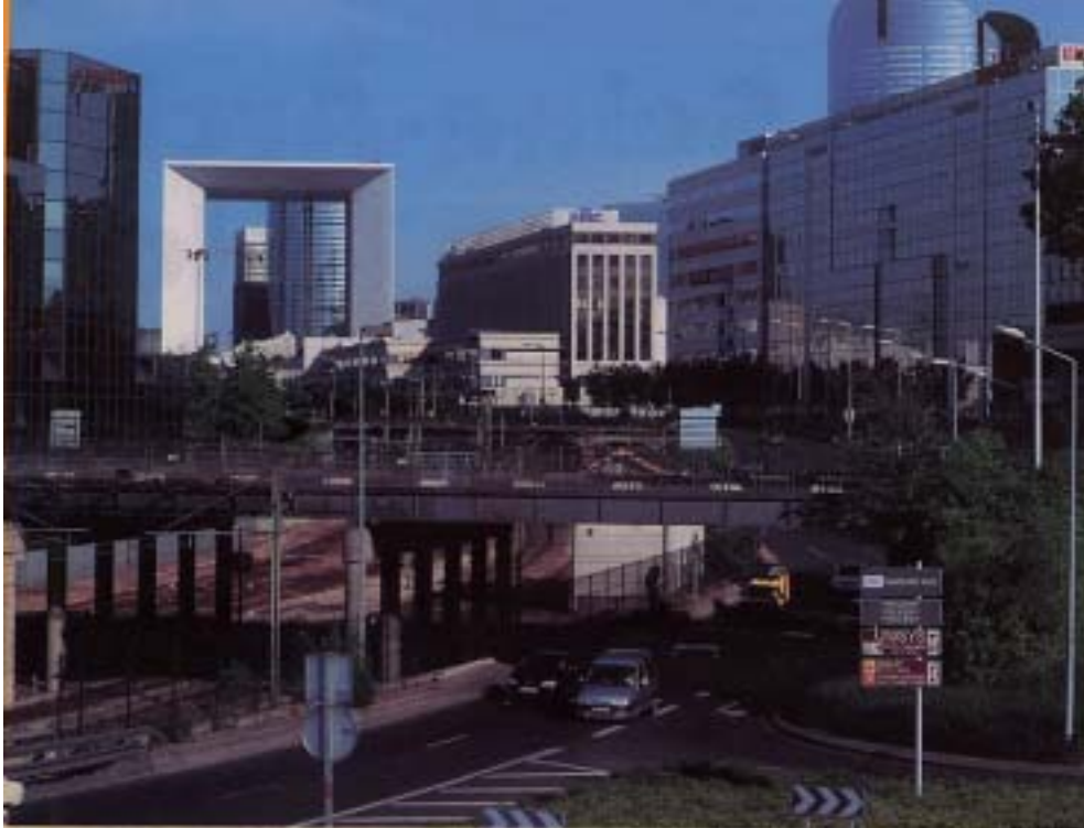
RN 231 - RN 314

hostilité à une approche à leurs yeux trop inféodée aux besoins de La Défense. La ville réclame d'inverser la logique : repartir du local, du "bas" vers le "haut", des besoins et des intérêts des quartiers pour refonder le projet. A un axe magnifié qui privilégie l'échelle métropolitaine et internationale du site, ils opposent l'idée d'un axe de circulation plus banalisé, facilitant les relations de voisinage et le remailage de Nanterre. Un grand débat lancé par la ville avec les habitants permet de définir les grandes priorités d'aménagement assigné à un projet qui, avant d'être "métropolitain", doit "réparer" le territoire : désenclaver